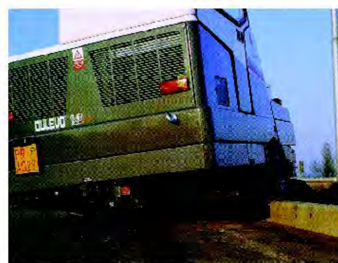
Transmisión directa con rueda motorizada

La 120 Elite es sumamente manejable: puede invertir la dirección de marcha con un radio de viraje de unos 1,3 metros según las normas CLUNA.