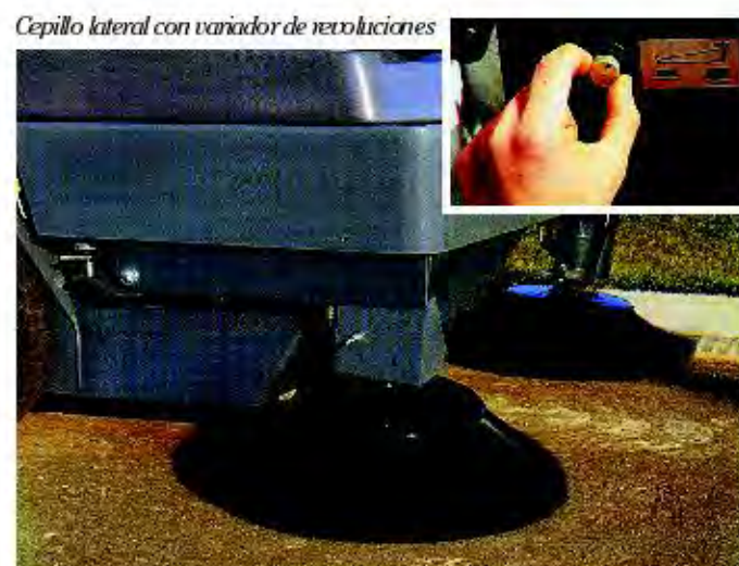
Cepillo lateral con variador de revoluciones