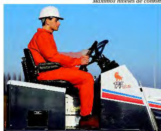
Máximos niveles de confort