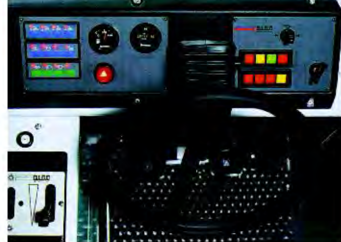
Cuadro de mandos