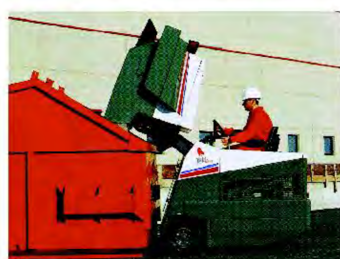
Descarga en cola