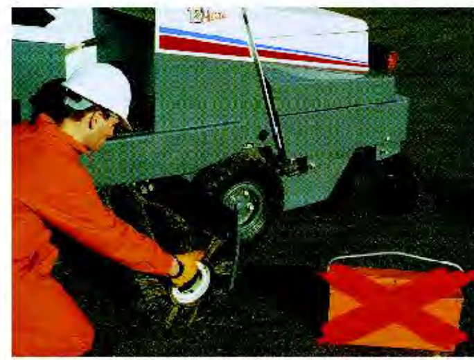
Desmontaje del cepillo central sin usar herramientas